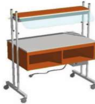
RE 9.2.1 RE 9.3.1