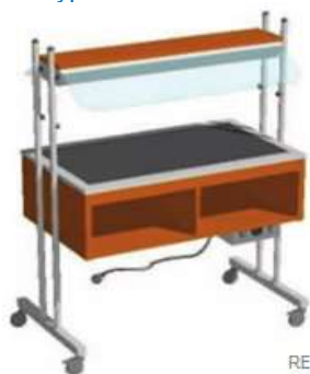
RE 10.3.1 RE 10.4.1

Untertyp RE 10.5.1 - mit glaskeramischer Platte